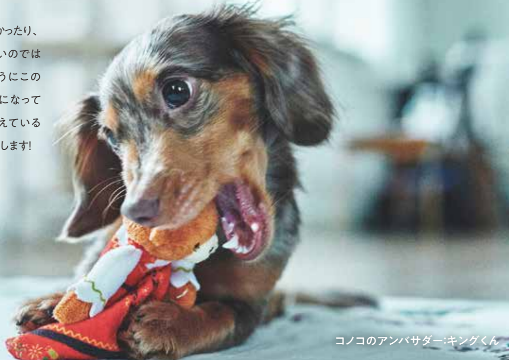
コノコのアンバサダー:キングくん

雨の日が多くなる梅雨の時期。気分が晴れなかったり、ストレスを感じやすくなったりする人も多いのではないのでしょうか?実はわんちゃんも同じようにこの時期は、どうしてもストレスが溜まりがちになってしまいます。そこで今回は、ストレスを抱えているわんちゃんの行動とストレス解消法をご紹介します!