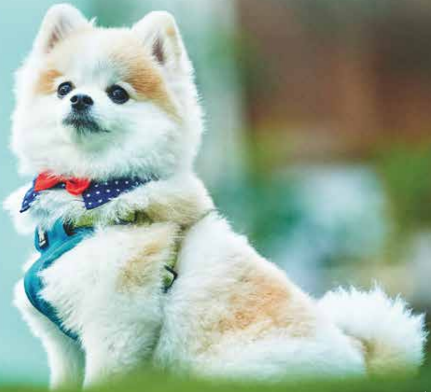
コノコのアンバサダー:ヤマくん

近年はわんちゃんと遊べる場所が増え、世間的にも出かけることが多くなったのではないのでしょうか? たくさんのわんちゃんと出会うドッグランでは、犬の社会化を学ぶことができます! ドッグランに行ってみたくて初めてでどうしたらいいかわからない、トラブルなく過ごせるか不安... などあると思います。わんちゃんも飼い主さんも楽しめるよう事前準備のポイントをしっかり押さえて、わんちゃんと楽しい時間を過ごしましょう!