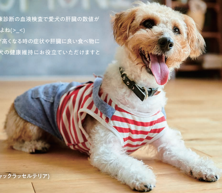
北海道のchocoちゃん(ジャックラッセルテリア)

見た目は元気なのに、健康診断の血液検査で愛犬の肝臓の数値が高く出ると不安になりますよね(>_<) わんちゃんの肝臓の数値が高くなる時の症状や肝臓に良い食べ物について知り、少しでも愛犬の健康維持にお役立ていただけますと幸いです!