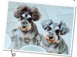
左:リンちゃん 右:ネネちゃん

イベント中には、第1期アンバサダーを務めていただいたネネちゃん(インスタグラム:@nene.s0515)の同郷のシュナウザーちゃん・ご家族様ともお会いすることができ、とても素敵な時間になりました♪ブースでたくさんお話をさせていただいた皆さま、ありがとうございました！